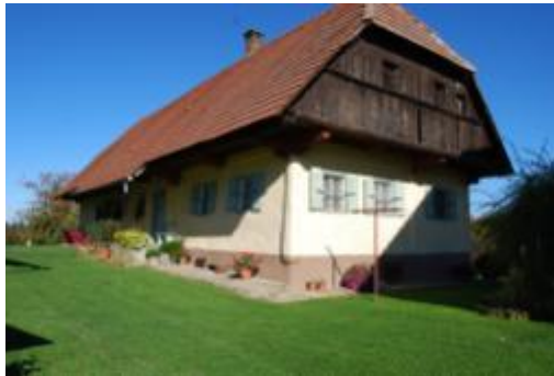
Slika 19: Vuzmova domačija na Vardi

Hiša je bila zgrajena leta 1787. Zgradba je lep primer hiše bogate vinogradniške kmetije. Večji del hiše je stanovanjski del z vežo, kuhinjo, veliko sobo in kamro, podstrešje pa skriva dragocene predmete, ki nas učijo o življenju kmečkih ljudi nekoč.