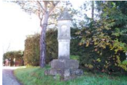
Slika 18: Kužno znamenje

V 17. stoletju je kuga kar osemdesetkrat razsajala v Evropi, zajela je tudi Slovenske gorice. Najhuje je bilo na Štajerskem prav v drugi polovici 17. stoletja. Kužna znamenja so postavljali v spomin na to strašno bolezen. Eno izmed kužnih znamenj je tudi ob domačiji Gragerjevih 26 v Jurovskem Dolu. Na stebru je postavljen kamniti križ in vklesana letnica 1676.