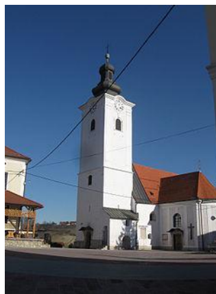
Slika 8: Trg pred cerkvijo sv. Jurija

Cerkev je poimenovana po svetniku sv. Juriju. Cerkev sv. Jurija v Slovenskih goricah se prvič omenja leta 1388. Sedanja župnijska cerkev z osrednjo gotsko ladjo je bila sezidana leta 1501.