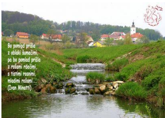
Slika 2: Vabilo na prireditev leta 2015

Jurjevanje je največja tradicionalna prireditev, ki sega že v leto 1992. Leta 1993 se je projekt razširil na blagoslov konjev, saj je bil Zeleni Jurij poleg drugih živali tudi zavetnik konjev. Prireditev bo potekala v nedeljo 28. aprila. To je enodnevna turistična prireditev. Gre za osrednji dogodek ob krajevnem »žegnanju«. Na Jurjevanju se predstavijo obrtniki iz ožje in širše okolice. Na trgu v Jurovskem Dolu se zbere več kot 1000 ljudi in hodi med tržnicami, si ogleduje razstave in prisostvuje pri cerkvenem obredu. Največja pridobitev Jurjevega pa je blagoslov konjev. V povorki se zbere več kot 100 konjerejcev, ki prihajajo iz celotne Slovenije.