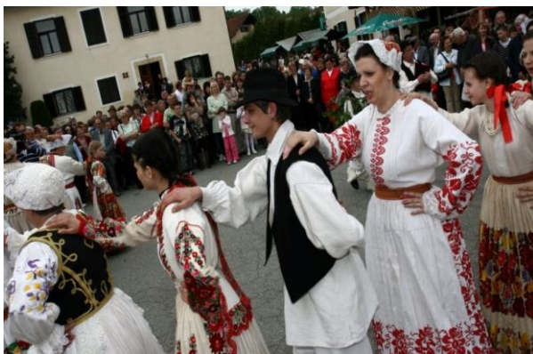
Slika 4: Na Jurjevanju sodelujejo tudi folkorne skupine iz sosednje Hrvaške.