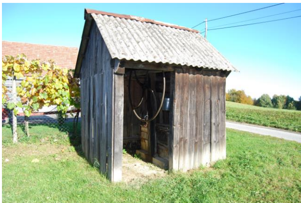
Slika 13: Žagarjev vodnjak z nadstrešnico in kolesom.

Na tem postanku jih bo sprejel domači glasbenik in na Malni bo zadonela slovenska pesem. Pohodniki se bodo okrepčali z jabolčnim in bezgovim sokom ter z namazi iz domačih zelišč. Društvo kmečkih gospodinj bo pohodnike pogostilo z domačim pecivom. Ob stavbi je vodnjak, globok 43 metrov. Kolo, vreteno in nadstrešnica so značilni za to območje. Prav tako bodo pohodniki zavrteli kolo vodnjaka in se odžejali z najbolj zdravo pitno vodo.