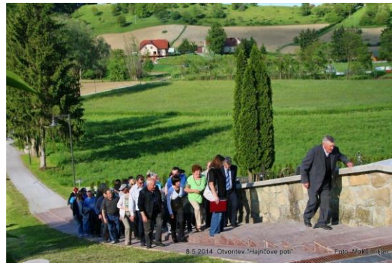
Slika 11: Ob otvoritvi Hajnčove poti