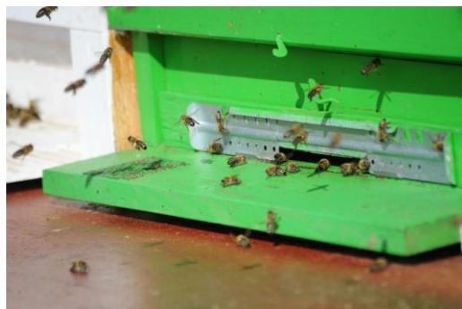
Slika 7: Obiskovalci si lahko ogledajo čebeljak ob dnevu odprtih vrat

Iz gozdne jase bo prišla Vila Globovnica z zelišči in obiskovalcem spregovorila o vrednosti posameznih zelišč in jih popeljala po zeliščnem vrtu.