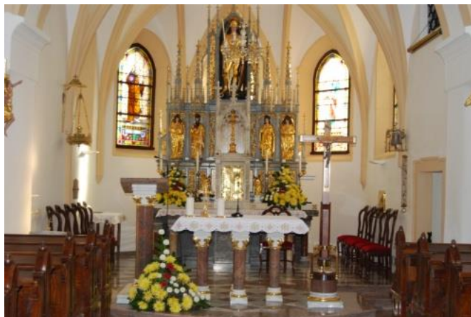
Slika 9: Glavni oltar v cerkvi je posvečen farnemu zavetniku.

Cerkev je bila poslikana s freskami iz 14. stoletja. V letih od 1784 do 1786 je bila izvedena v sklopu cerkvene reforme cesarja Jožeta II. osamosvojitve jurovske fare. Cerkev odlikuje ubrana notranjščina in bogata oprema s tremi oltarji.