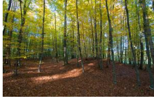
Slika 17: Gomilska grobišča v Jurovskem Dolu

V gozdu nad mlinom je pet gomil, ki še niso raziskane. Po raziskanih podobnih gomilah v sosedstvu pa lahko sklepamo, da so to žarne gomile iz antike. Umrle so takrat sežigali, pepel umrlih so dali v velike lončene posode – žare, le-te so obložili in pokrili s ploščami iz domačega peščenjaka. Pridodali so pokojniku ljube predmete.