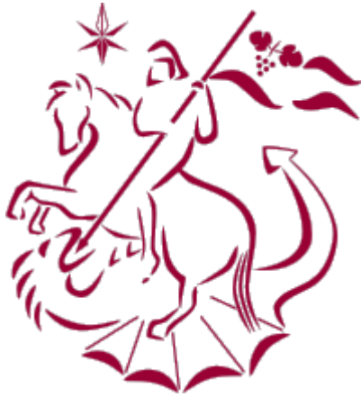
Slika 1: Grb občine Sv. Jurij

Na zastavi je grozd z dvema trtnima listoma, ki predstavlja vinorodnost našega območja. V levi zgornji strani je šesterokraka simetrična zvezda. Njeni kraki so rahlo izbočeni. Podobne tri takšne zvezde najdemo na našem največjem arhitekturnem spomeniku, cerkvi Sv. Jurija. Jurij kot Pomlad, ki premaga Zimo, iztrga iz kremljev Zemljo, ogroženo kraljično (legenda o Juriju).