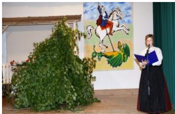
Slika 5: Simbol Jurjevanja je Zeleni Jurij