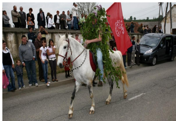
Slika 3 : Zeleni Jurij je odet v bukovo vejevje