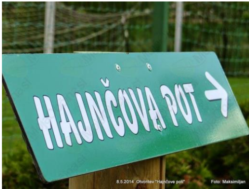
Slika 10: Tabla Hajnčove poti