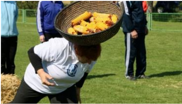
Slika 20: Nošeno koruzo bo potrebno tudi luščiti.

preskakovanje ovir in skakanje z vrečami. Starejši otroci bodo hodili po vrvici in se preizkušali v moči. Na koncu bomo podelili priznanje za najbolj številčno družino, za najmlajšega in najstarejšega udeleženca športne prireditve Jurik Špas.