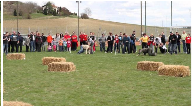
Slika 21: Vožnja slamnatih bal s samokolnico