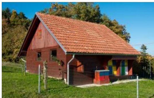
Slika 6: Učni čebeljak

Pohodnike bo tu sprejel čebelar in jim razkazal učni čebeljak. Pohodniki si bodo lahko kupili različne vrste medu.