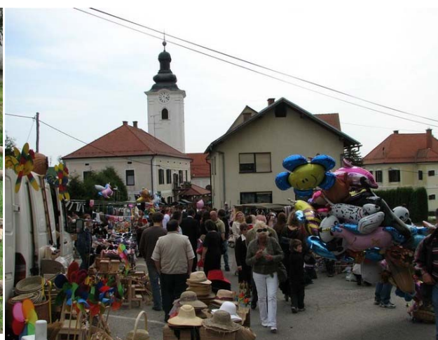
Slika 12: Na osrednjem trgu se zbere ogromno obiskovalcev.