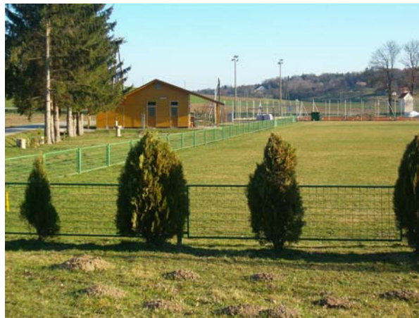
Slika 19: Pot vodi mimo športnega objekta