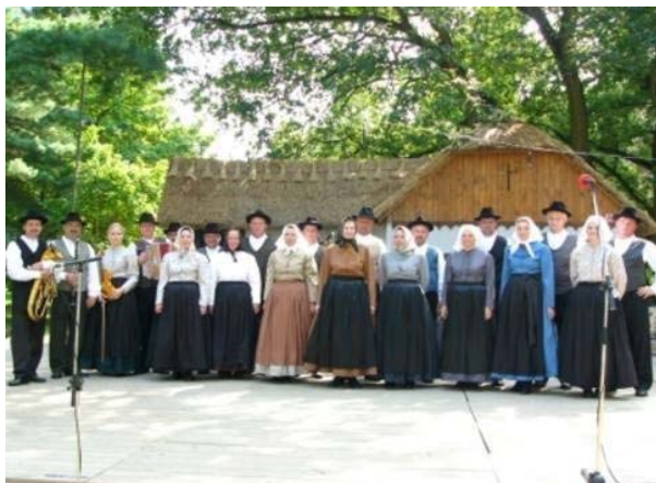
Slika 13: Folklorna skupina Jurovčan v Beltinci.