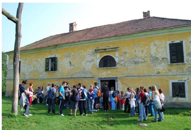
Slika 2: Učenci predmetne stopnje pred Senekovičevim dvorcem