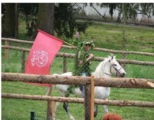
Slika 11: Zeleni Jurij z občinsko zastavo .