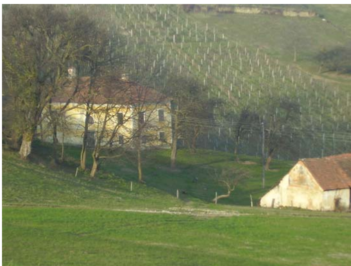
Slika 1: Pogled na Senekovičev dvorec

V 19. stoletju so bili lastniki tega gradu avstrijski plemiči Spitzzy.