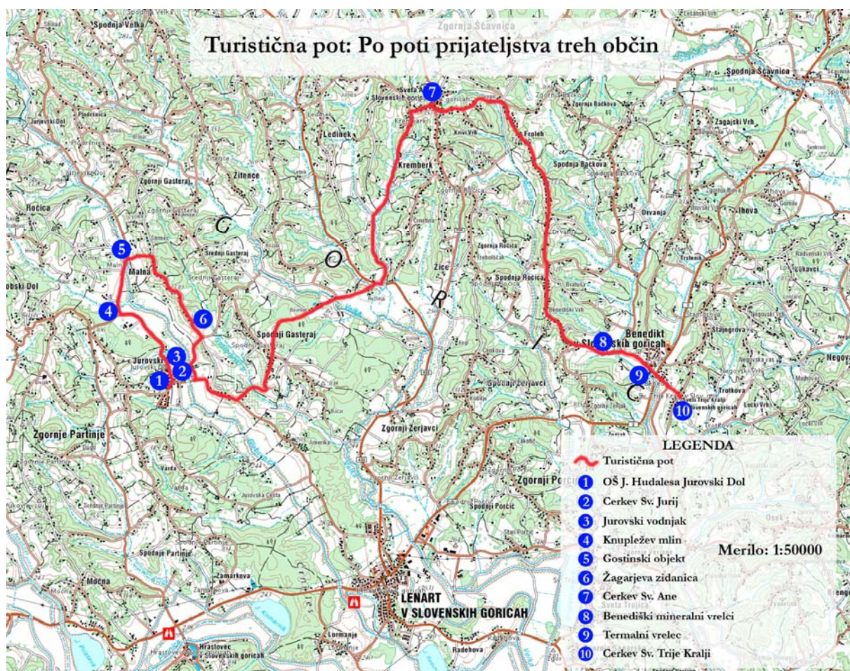
Zemljevid občine Sv. Jurij s sosednjimi občinami