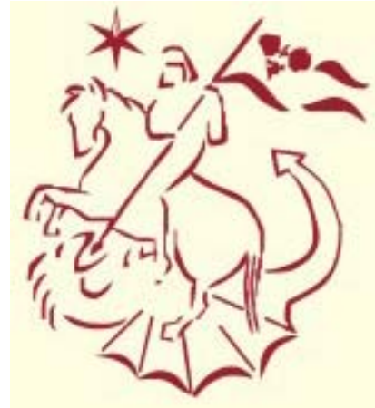
Grb občine Sv. Jurij