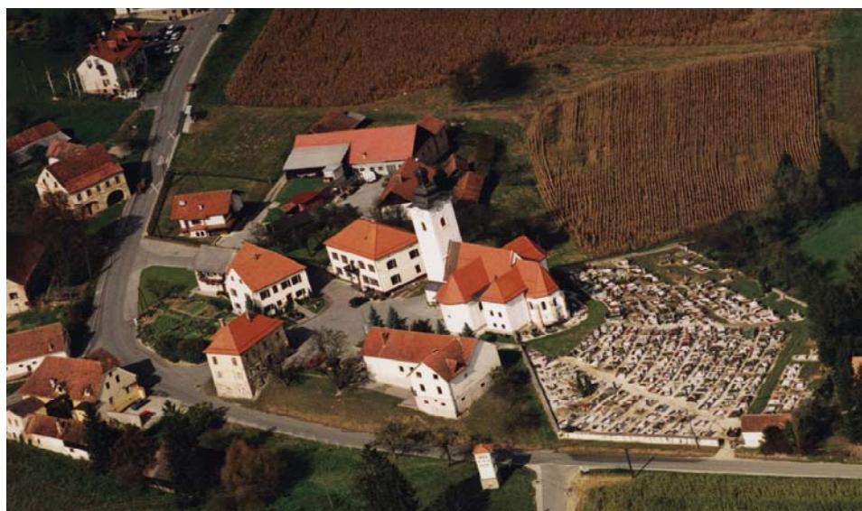
Slika 7: Jurovski Dol je centralno naselje občine Sv. Jurij

Jurovski Dol je bil naseljen že v mlajši kameni dobi in v dobah kovin. O tem pričajo pred antične in antične gomile v Jurovskem Dolu, Spodnjem Gasteraju in Srednjem Gasteraju. Najbolj znana najdba iz