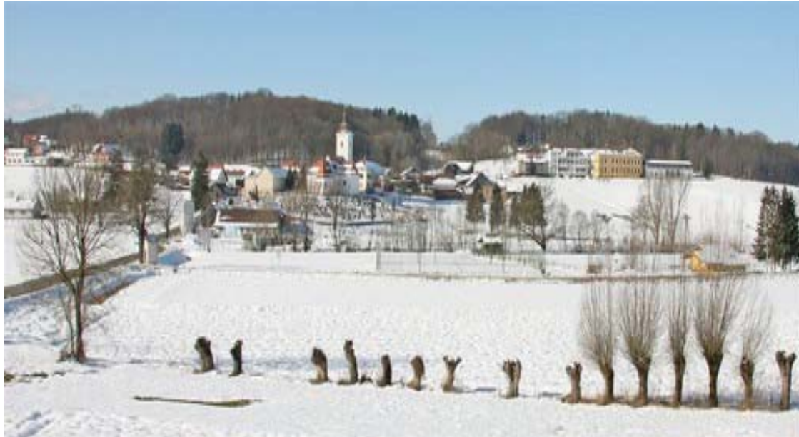
Slika 6: Zimska idila v Jurovskem Dolu

naselja po vrhovih pa razmejujejo še potoki Velka, Partinjšak in Gasterajski potok. Poti, ki so speljane z vseh vrhov proti centru kraja, so večidel asfaltirane. Sredi gručastega jedra stoji gotska cerkev sv. Jurij iz 16. stoletja, največji kulturno-arhitekturni spomenik v kraju.