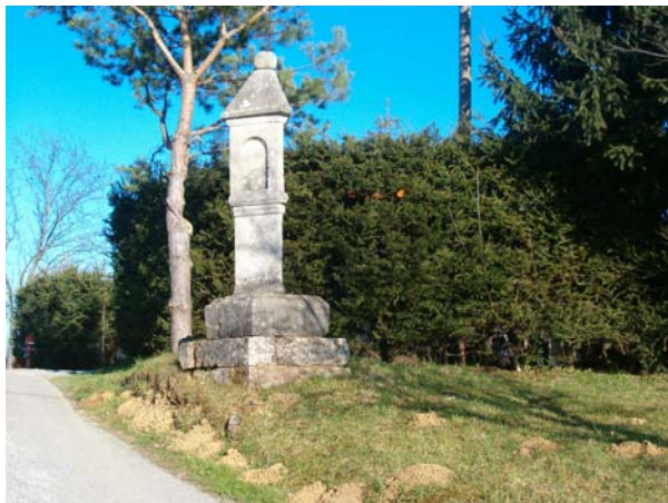
Slika 18: Kužno znamenje

Ideje za turistično pot so pripravili učenci turističnega podmladka, realizacija pa bo potekala pod mentorstvom strokovnih delavcev šole in zunanjih sodelavcev. Del sredstev bo sofinancirano preko projekta Lokalne strategije Ovtar Slovenskih goric. Projekt bo promoviran na Jurjevih dnevih v mesecu aprilu.