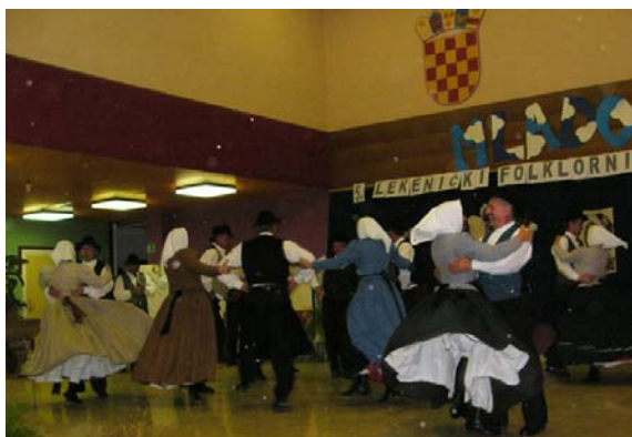
Slika 15: Nastop folklorne skupine Jurovčan v Lekeniku v sosednji Republiki Hrvaški.