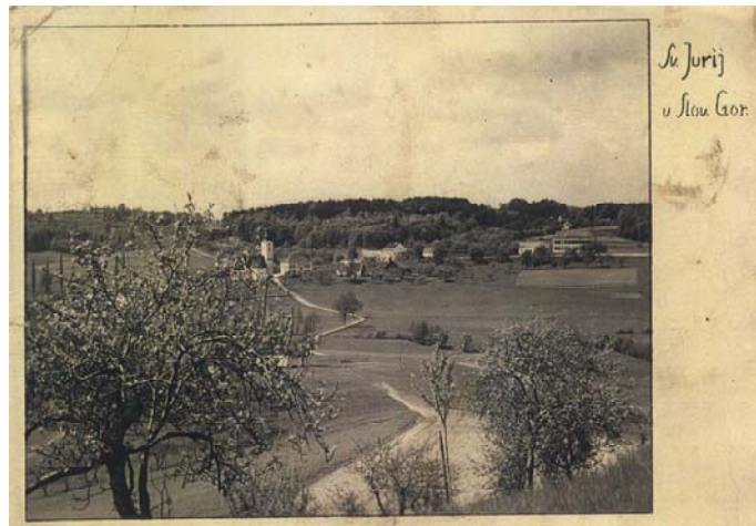
Slika 8: Jurovski Dol v obdobju med obema vojnama