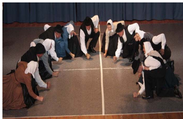
Slika 16: V Lenartu na območnem tekmovanju so se predstavili v letu 2009 z odrsko postavitvijo »NA ŠTĚRO«.